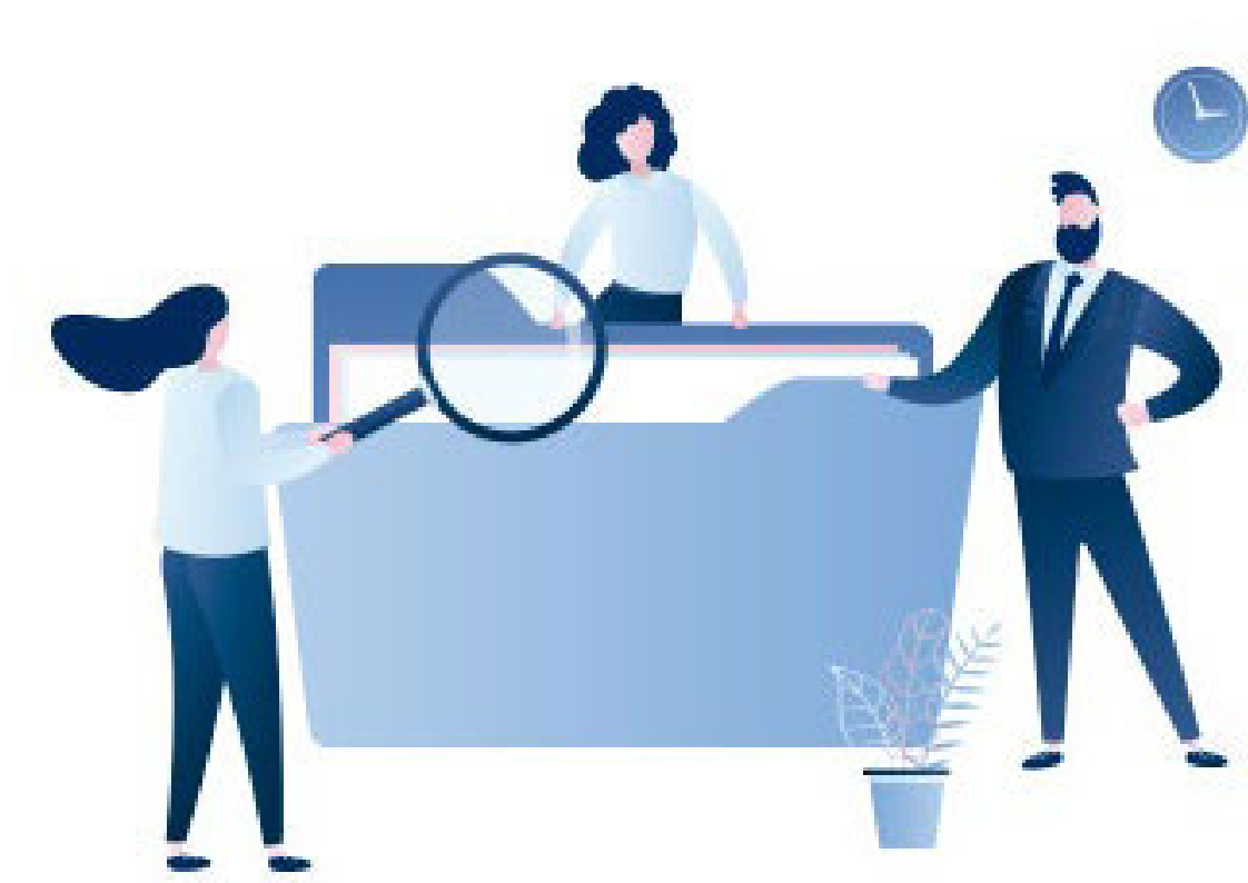
Imagen obtenida de: https://www.soyconta.com/ley-de-fomento-a-la-confianza-ciudadana/

Finalmente, una enorme tarea será diseñar mecanismos adecuados para potenciar la presencia e influencia de las mujeres en el proceso electoral desde los diferentes roles que asumen antes, durante y después de la jornada electoral. RETOS Y DESAFÍOS PARA