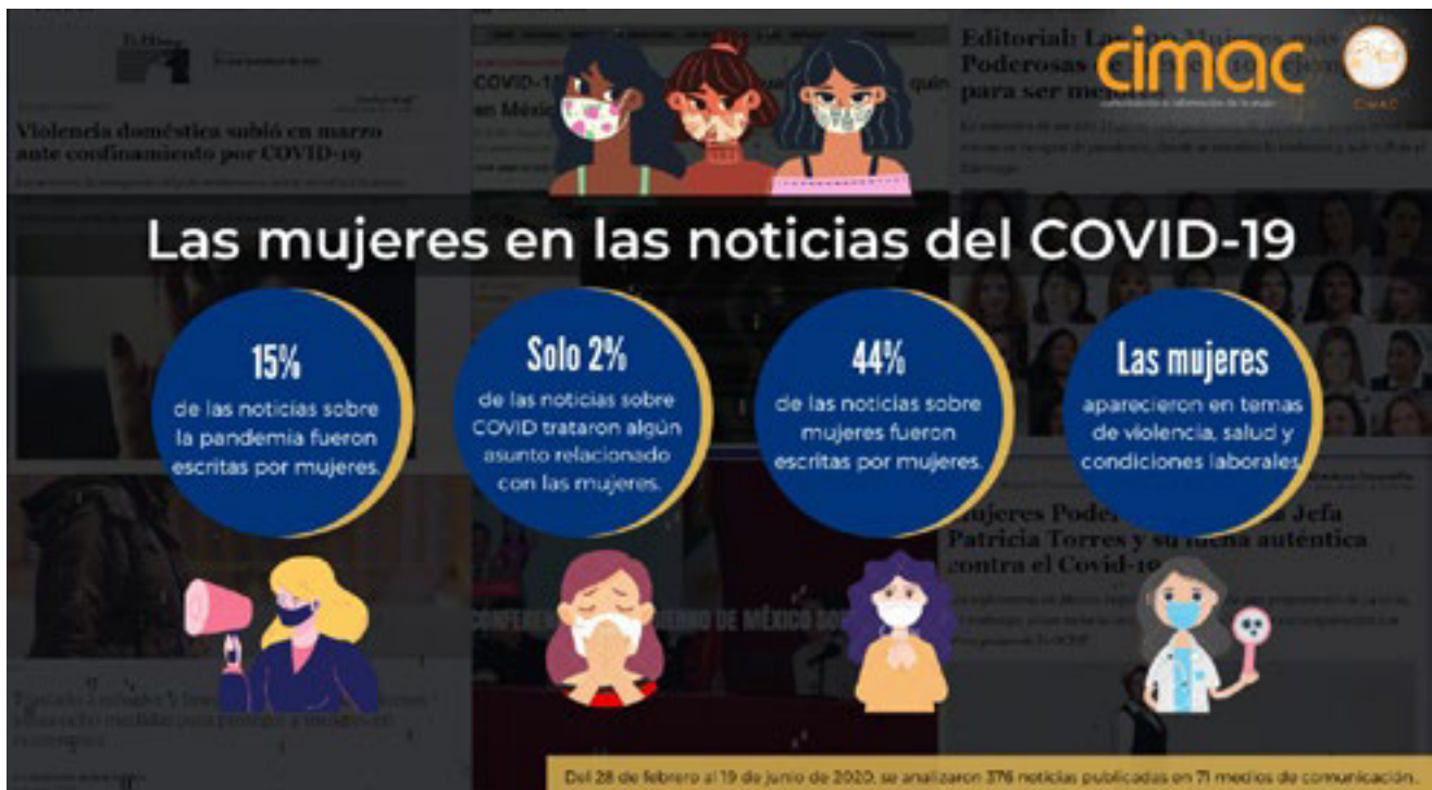
Infografía elaborada por CIMAC

El observatorio de medios de Comunicación e Información de la Mujer, CIMAC, desde hace 8 años realiza un observatorio de las representaciones de la participación política de las mujeres. Pese al avance en el reconocimiento de los derechos políticos de las mujeres los medios de comunicación siguen resistiéndose a mostrar el cambio y sus coberturas informativas siguen reproduciendo sexismos discriminatorios.